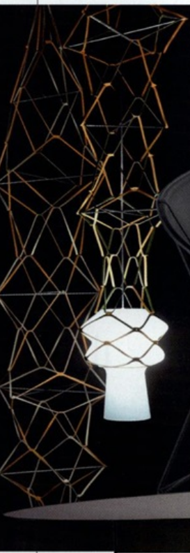
Lampada Stelle Filanti, di vetro soffiato e cuoio, di atelier aï, Venini Artlight .

Sarà per il momento storico d'incertezza, ma sono tanti i pezzi che giocano sulla leggerezza (almeno apparente). Una sensazione che trasmettono spesso i lavori di Ron Gilad , creativo israeliano super premiato: quest'anno è stato nominato «Designer of the Year» sia da Wallpaper che da Elle Decor.