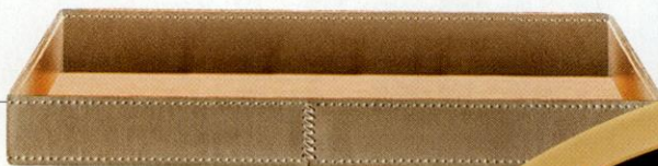
Поднос Mik, кожа, Minotti, €583.