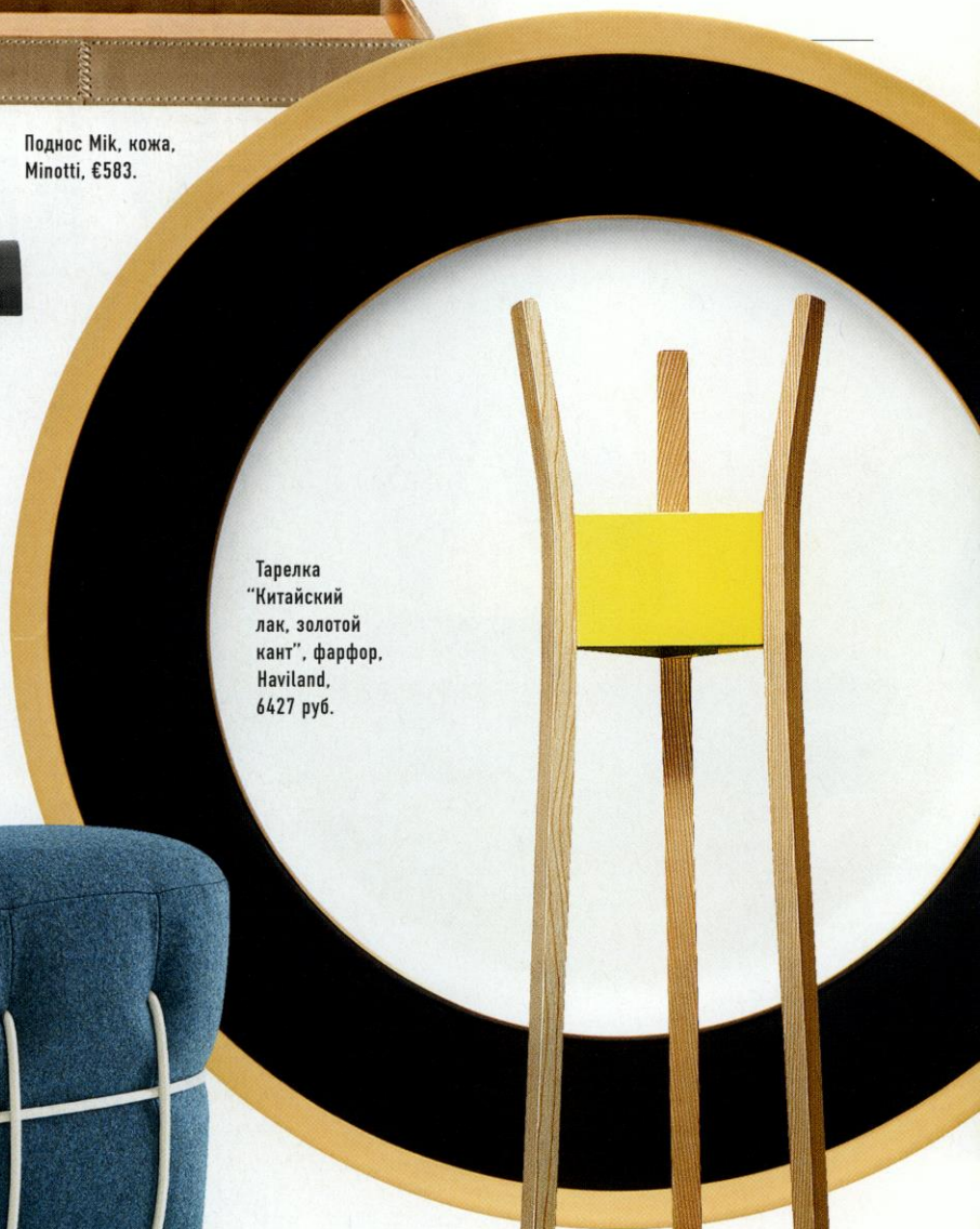
Тарелка "Китайский лак, золотой кант", фарфор, Naviland, 6427 руб.