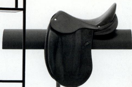
Подарочный набор — седло и подставка для седла, дерево, кожа, латунь, Christian Liaigre, €9311.